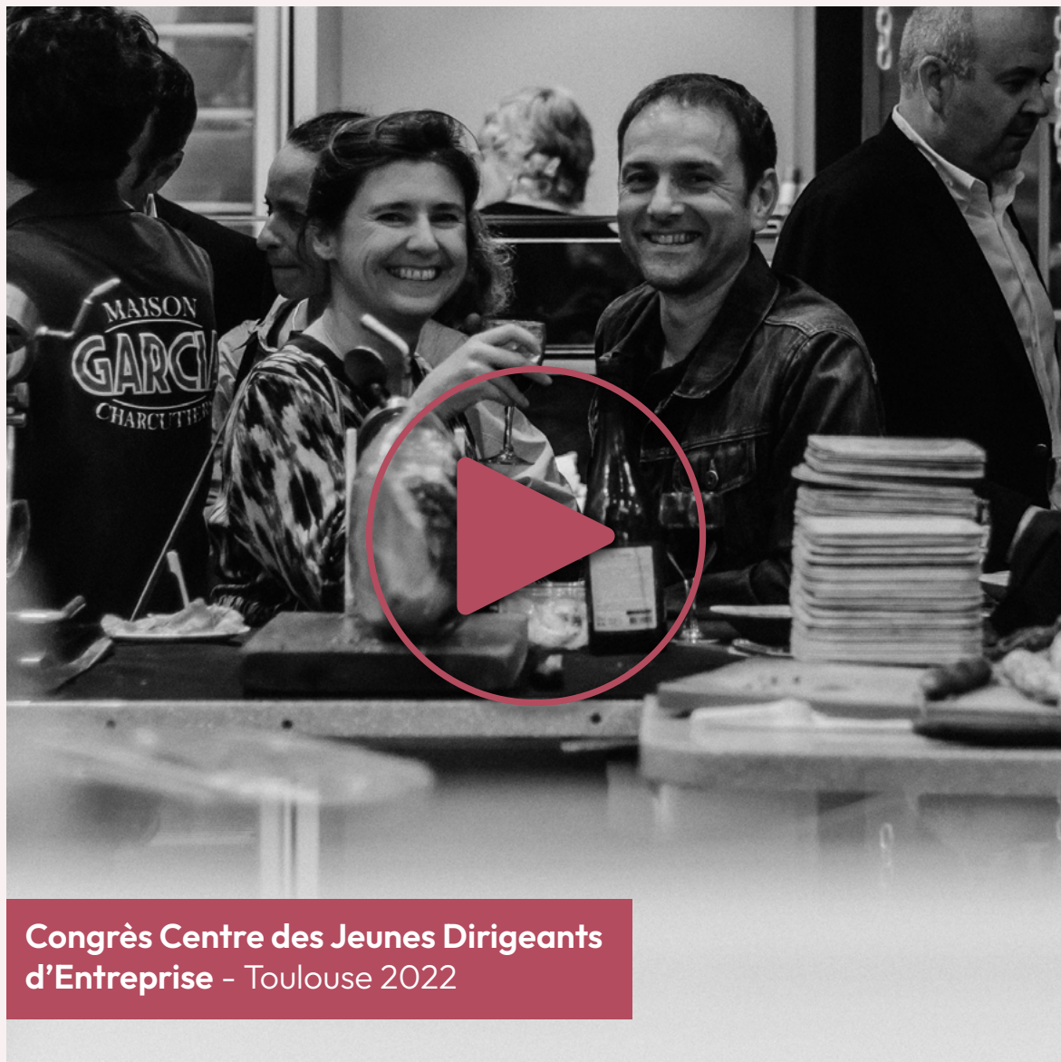
Congrès Centre des Jeunes Dirigeants d'Entreprise - Toulouse 2022