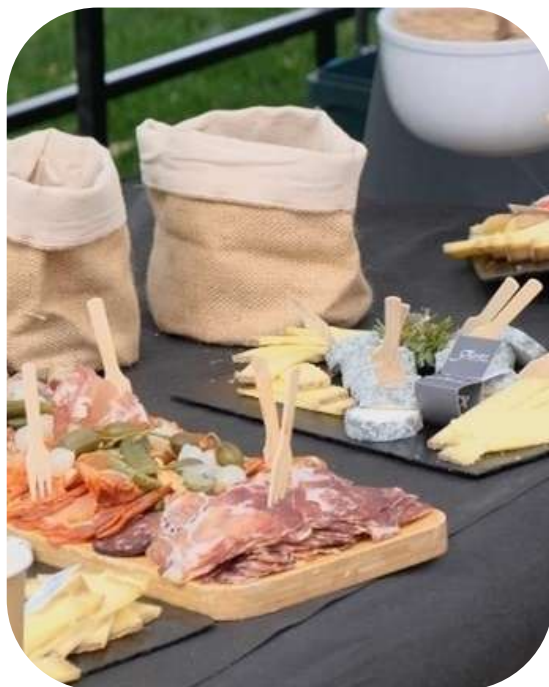
TRAITEURS Produits locaux, végétariens, traitement des déchets organiques