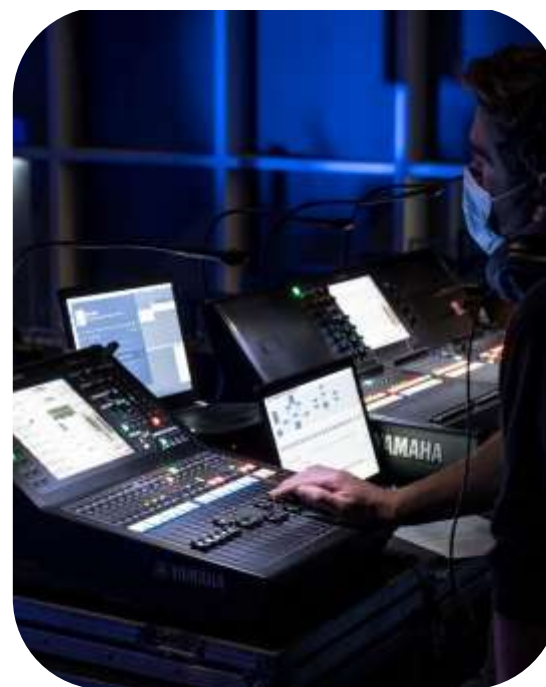
AGENCES PCO, DMC, animation, incentive