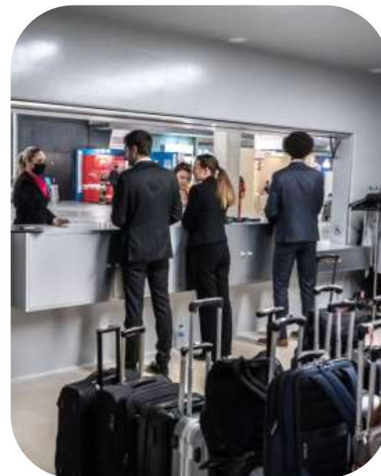
SUPPORT TECHNIQUE Audiovisuel, transports, hôtes et hôtesses, fournisseurs de mobilier